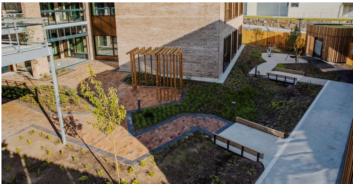
Dette er demenslandsbyen på Søm, med et gulvareal på 6200 kvadratmeter.